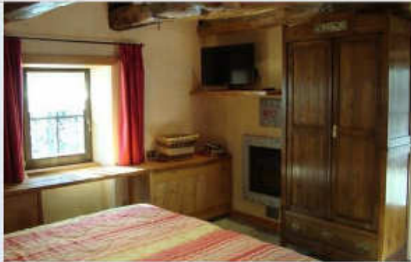
B&B LA QUANA